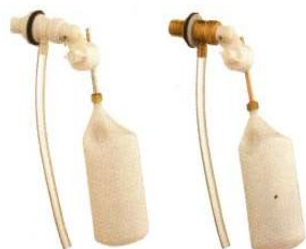
ARTÍCULO 247 GRIFO FLOTADOR SILENCIOSO DE PLÁSTICO CON BOYA PLANA