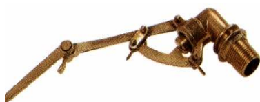
ARTÍCULO 200 A FLOTADOR GUÍAS VARILLA ARTICULADA