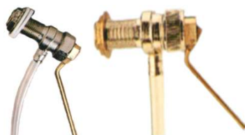
ARTÍCULO 178 A GRIFO FLOTADOR SILENCIOSO DE 3/8"