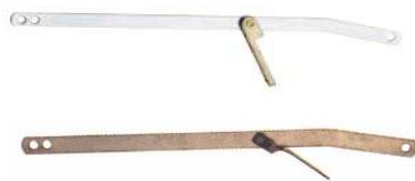
ARTÍCULO 169 PALANCA WC CON SOPORTE