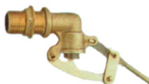
ARTÍCULO 200 FLOTADOR GUÍAS VARILLA CON ROSCA