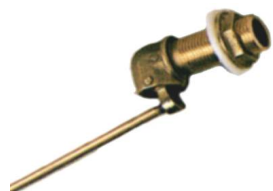
ARTÍCULO 116 GRIFO FLOTADOR OLLETA