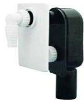
FIGURA DESCRIPCIÓN CÓDIGO MEDIDA BOLSA PRECIO EUROS